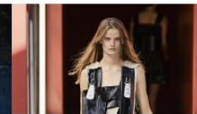
13 ГОЛОВНИХ ТРЕНДІВ СЕЗОНУ ВЕСНА-ЛІТО 2023