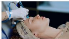
ПРО ВПЛИВ СТРЕСУ НА СТАН ШКІРИ