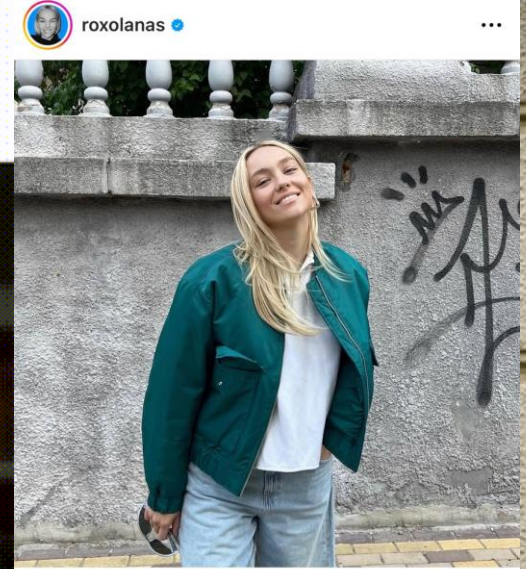
Уподобали: _le_to та інші люди roxolanas неділя в Києві 🌿🌸💚 in my beloved @marcopolo denim @intertop.ua 🌟