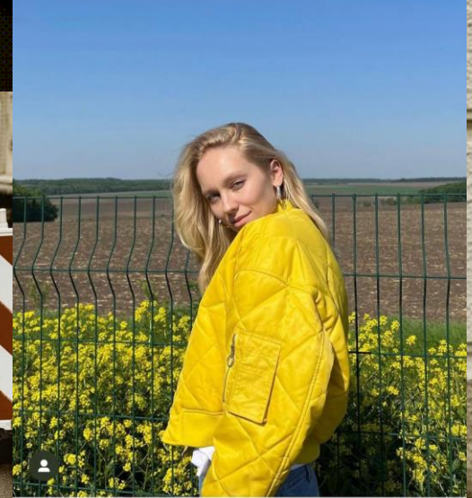
Уподобали: an_i_k_o та інші люди roxolanas Дуже жовтий настрій від улюблених @marcopolo @intertop.ua 🍋🍌🌟