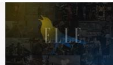
ХРОНІКИ ПОВНОМАСШТАБНОЇ ВІЙНИ